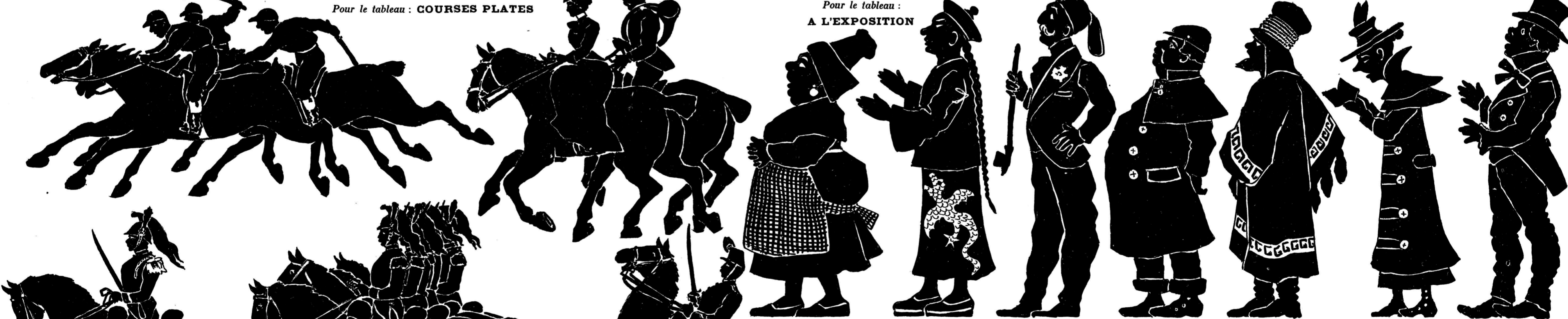
Pour le tableau : A L'EXPOSITION