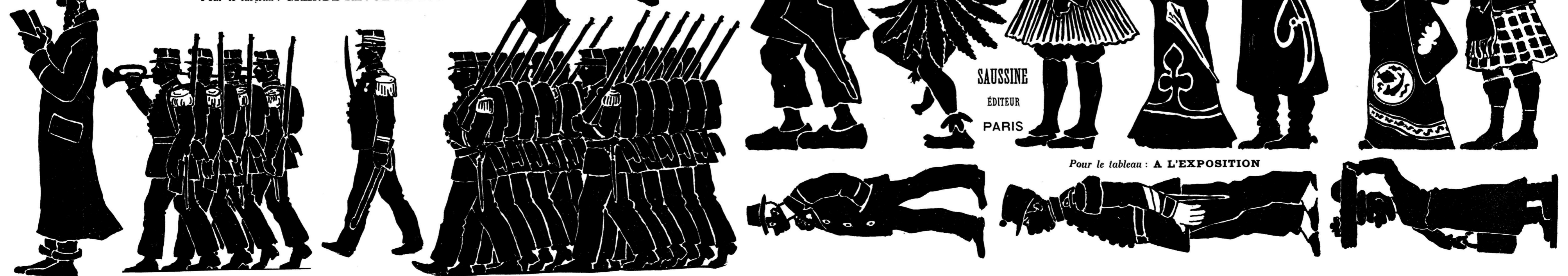
Pour le tableau : A L'EXPOSITION