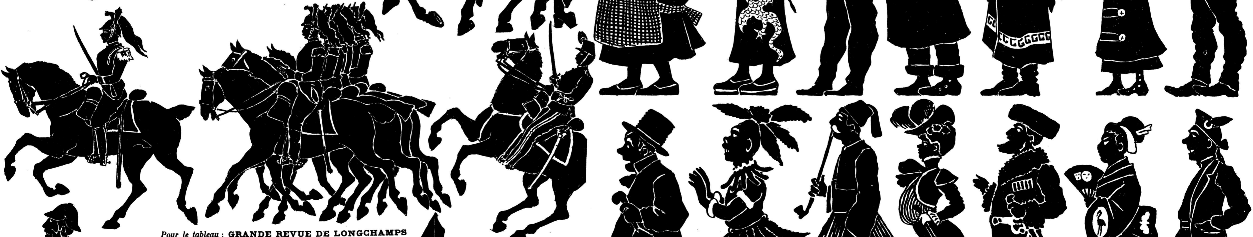
Pour le tableau : GRANDE REVUE DE LONGCHAMPS