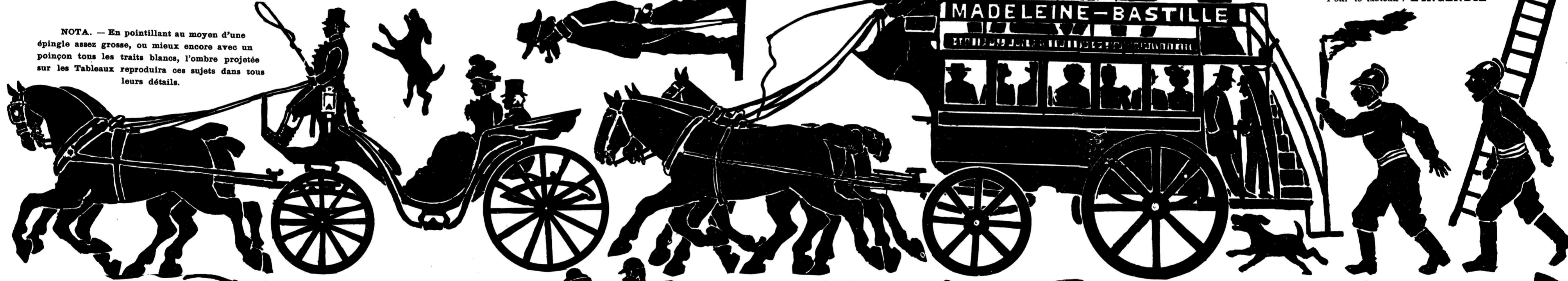
Pour le tableau : COURSES PLATES

NOTA. — En pointillant au moyen d'une épingle assez grosse, ou mieux encore avec un poinçon tous les traits blancs, l'ombre projetée sur les Tableaux reproduira ces sujets dans tous leurs détails.