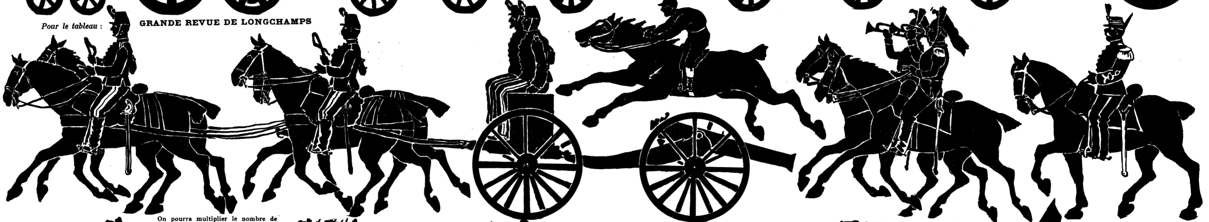
Pour le tableau : GRANDE REVUE DE LONGCHAMPS

On pourra multiplier le nombre de Soldats ou autres sujets en les décalquant avec un papier transparent et en découpant ce décalque préalablement collé sur un carton mince que l'on noircit à l'encre après.