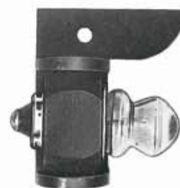
Socket (7) mit justierter Projektionslampe