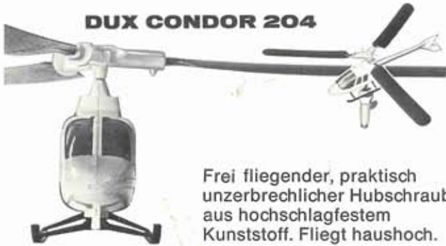
DUX CONDOR 204

Frei fliegender, praktisch unzerbrechlicher Hubschrauber aus hochschlagfestem Kunststoff. Fliegt haushoch.