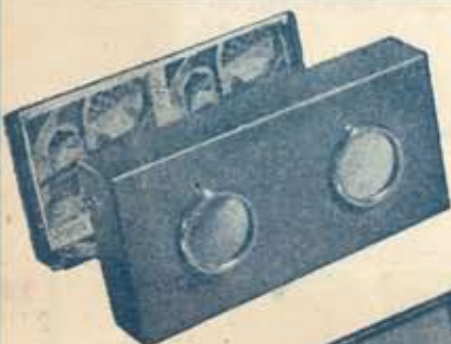
Modelo A-1 Aparato plegable para fotogr. cartulina tamaño 6x13. Ptas. 75