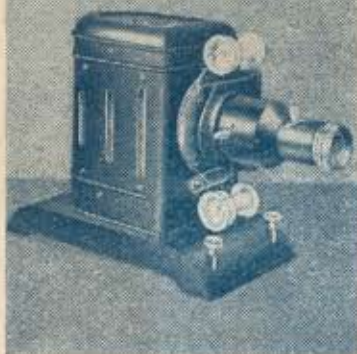
EPIDIASCOPO Modelo CRUZADA (Sólo para cuerpos opacos)

Cuerpo metálico, sirve para la proyección de toda clase de cuerpos opacos, equipado con lámpara de 500 vatios.